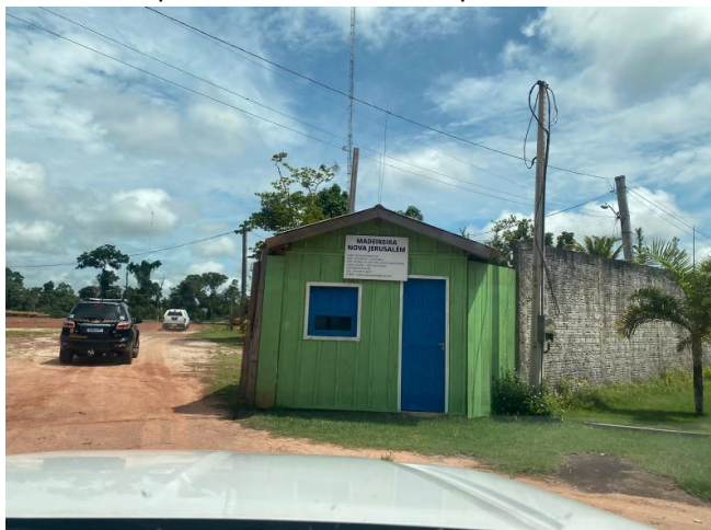
Diligência com a Polícia Federal em Madeireira