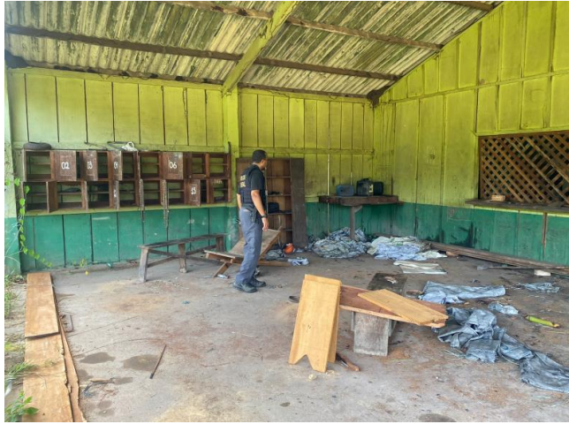
Agentes da a Polícia Federal em Madeireira