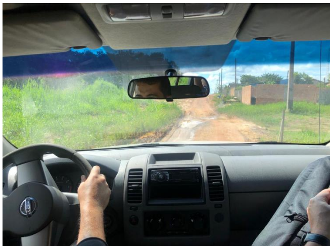
Condições das estradas até o local