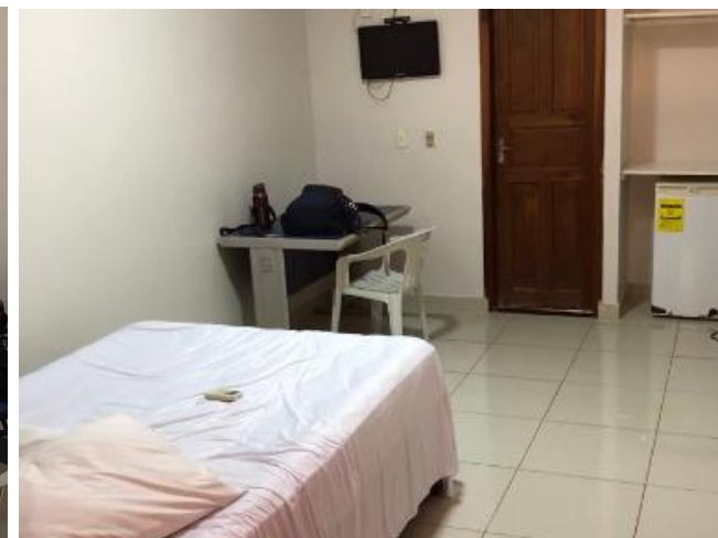
Hotel em Rorainópolis