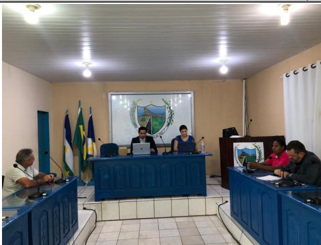
Realização de Audiência