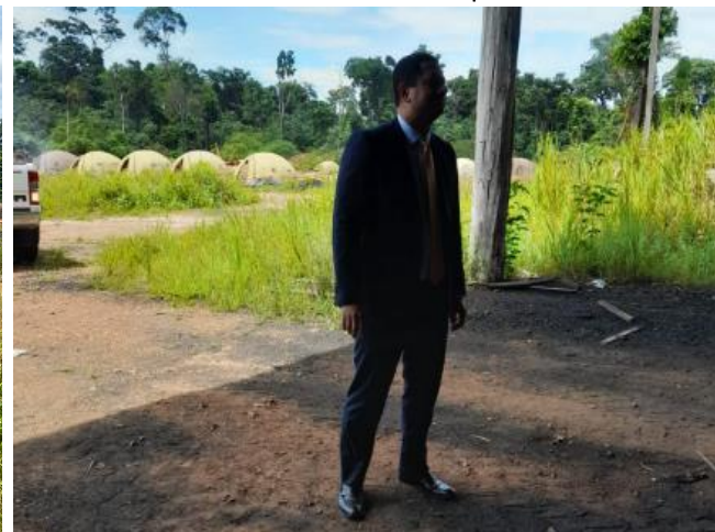
Juiz visualizando o barracão de trabalho