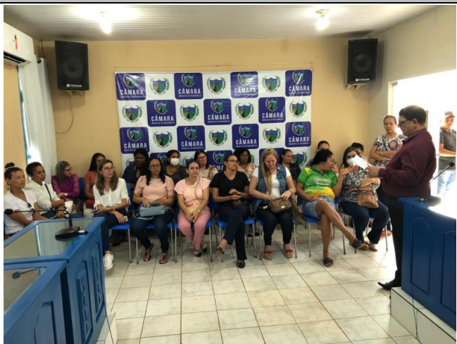
Público para ser atendido em apenas um dia

(sempre que viável, deverá ainda ser disponibilizado para a Corregedoria vídeos e entrevistas com os jurisdicionados, ainda que de forma amadora e dentro das possibilidades dos equipamentos utilizados, com o intuito de darmos conhecimento público a nível nacional da ampla prestação jurisdicional da Justiça do Trabalho em localidades longínquas do interior dos Estados do Amazonas e Roraima)