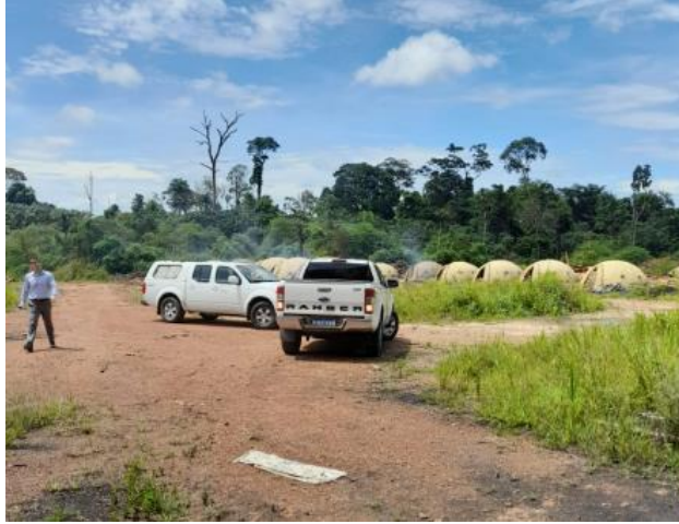
Procurador do Trabalho na Carvoaria Clandestina