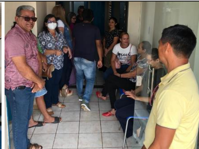
Público a ser atendido no quarto dia