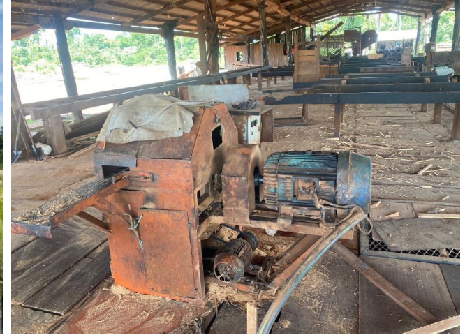
Maquinário da Madeireira